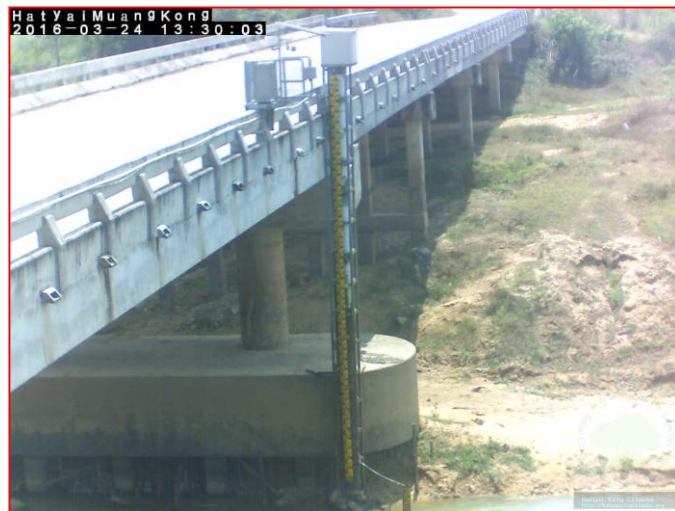
ปริมาณน้ำในลำน้ำของคลองต่างๆ ในพื้นที่ลุ่มน้ำทะเลสาบสงขลา