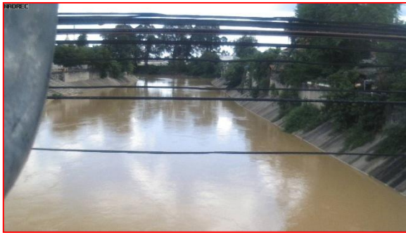
สถานีบ้านหาดใหญ่ใน - ต.หาดใหญ่ อ.หาดใหญ่ จ.สงขลา (ลุ่มน้ำทะเลสาบสงขลา)