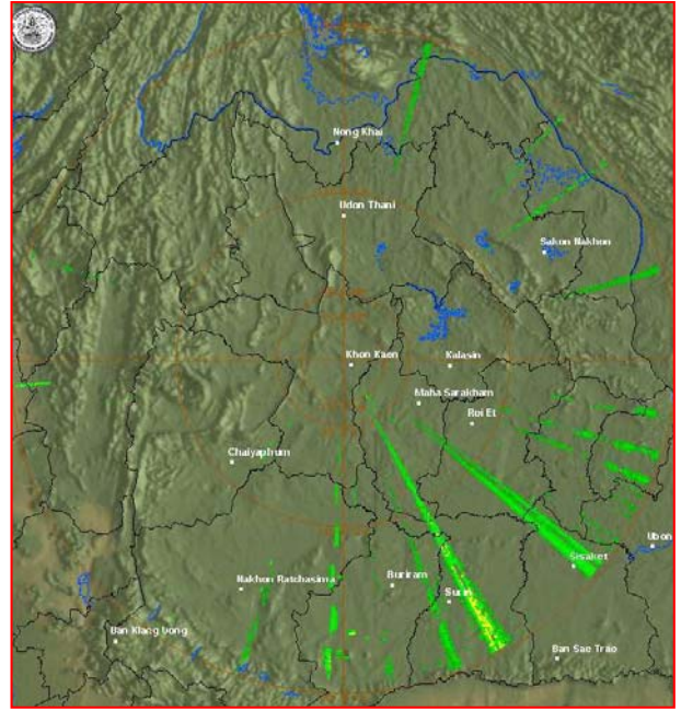
สถานีขอนแก่น เวลา ๐๗.๔๕ น.

จากเรดาร์ตรวจอากาศจะพบว่า มีกลุ่มเมฆฝนกระจายบริเวณภาคกลาง ภาคตะวันออก และภาคตะวันออกเฉียงเหนือ