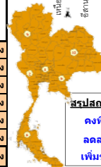
สรุปสถานการณ์ปริมาณน้ำในอ่างน้ำ