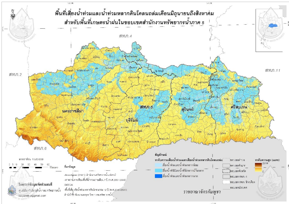
รูปที่ 2 พื้นที่เสี่ยงน้ำท่วมและน้ำท่วมหลากดินโคลนถล่มระหว่างเดือนมิถุนายน – สิงหาคม สำหรับพื้นที่เกษตรน้ำฝน ในขอบเขตสำนักงานทรัพยากรน้ำภาค 5

2.2 พื้นที่เสี่ยงน้ำท่วมและเสี่ยงน้ำหลาก - ดินโคลนถล่ม (ก.ย. - ธ.ค.) ระดับเสี่ยงภัยปานกลาง และเสี่ยงภัยมาก ในพื้นที่เกษตรน้ำฝนในขอบเขตสำนักงานทรัพยากรน้ำภาค 5 ประกอบด้วย