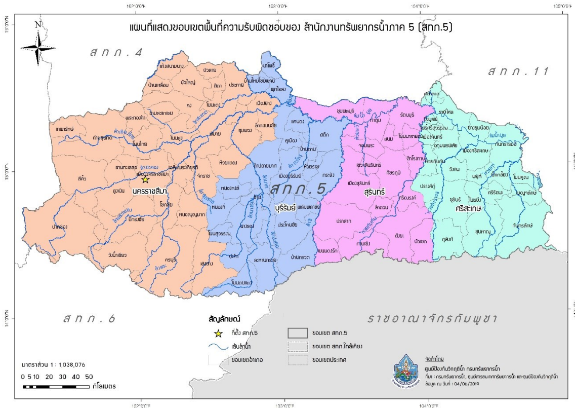
รูปที่ 1 ขอบเขตพื้นที่ความรับผิดชอบของสำนักงานทรัพยากรน้ำภาค 5

สำนักงานทรัพยากรน้ำภาค 5 มีพื้นที่รับผิดชอบ 4 จังหวัด ประกอบด้วย จังหวัด นครราชสีมา บุรีรัมย์ สุรินทร์ และศรีสะเกษ รายละเอียดแสดงดัง รูปที่ 1