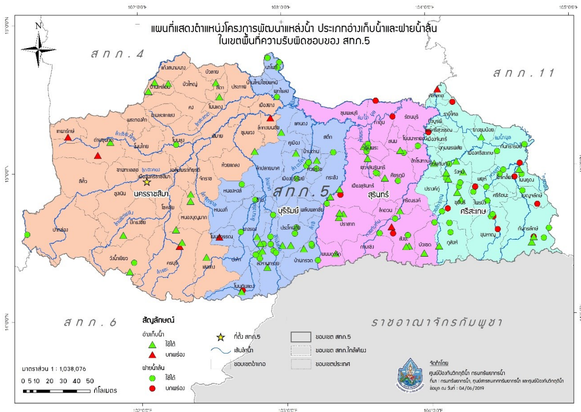
รูปที่ 5 ตำแหน่งโครงการพัฒนาแหล่งน้ำประเภทอ่างเก็บน้ำและฝายน้ำล้น ในเขตพื้นที่ความรับผิดชอบของสำนักงานทรัพยากรน้ำภาค 5