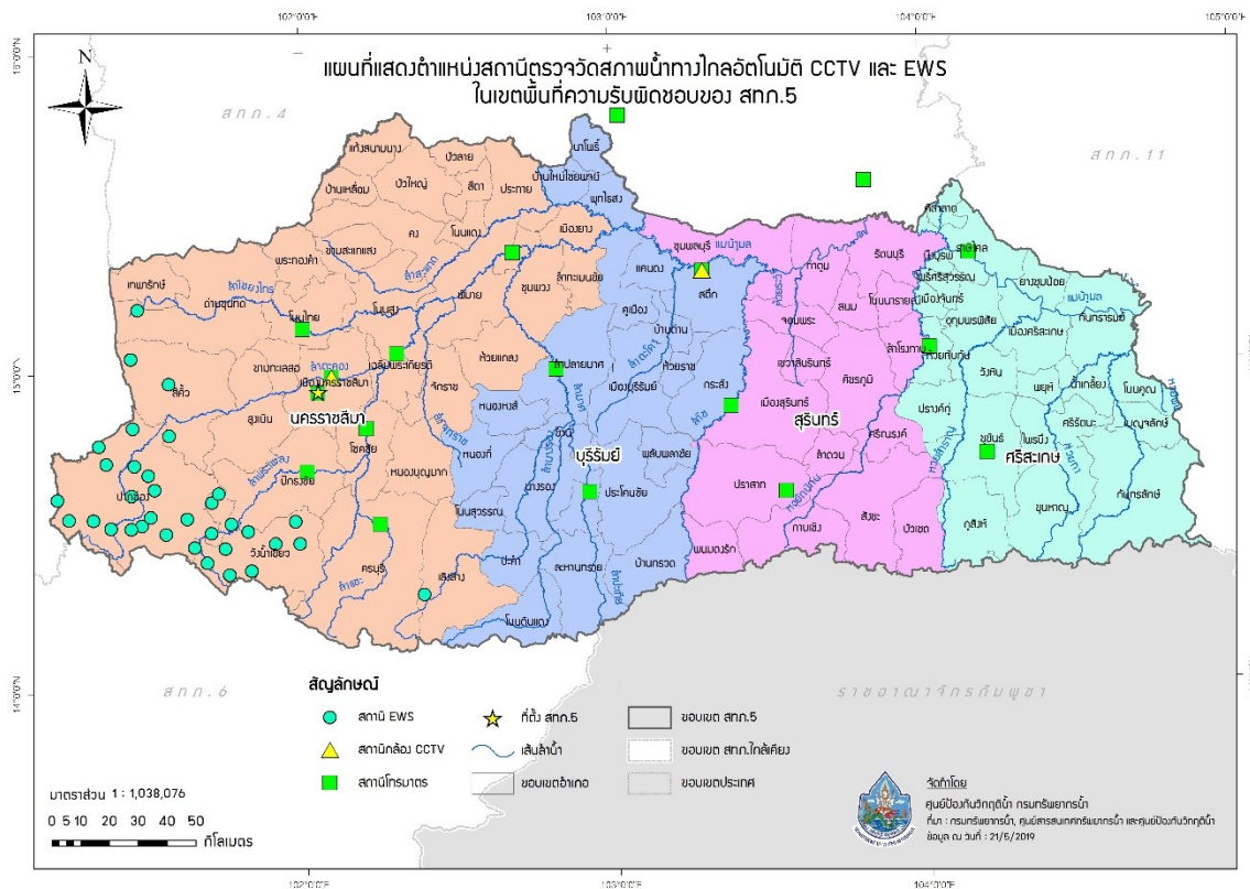
รูปที่ 4 ตำแหน่งสถานีตรวจวัดสถานการณ์น้ำ ในเขตพื้นที่ความรับผิดชอบของสำนักงานทรัพยากรน้ำภาค 5

รายละเอียดแสดงดัง รูปที่ 4 รายละเอียดของสถานีตรวจวัดสถานการณ์น้ำ แสดงใน ภาคผนวก 3 และสามารถดูรายละเอียดเพิ่มเติมได้ที่เว็บไซต์ http://mekhala.dwr.go.th/